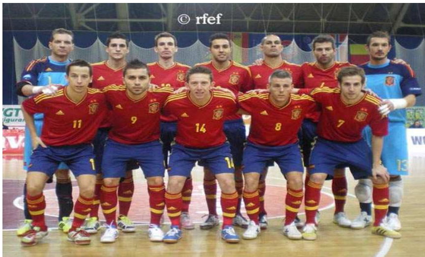
Selección Española de Fútbol-Sala

Cada equipo suele tener a un lanzador especialista con una técnica específica y sobre todo con un buen disparo a puerta.