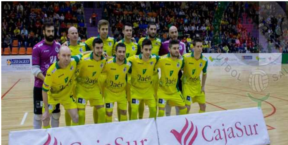
Jaén Paraíso Interior en la temporada 2014-2015