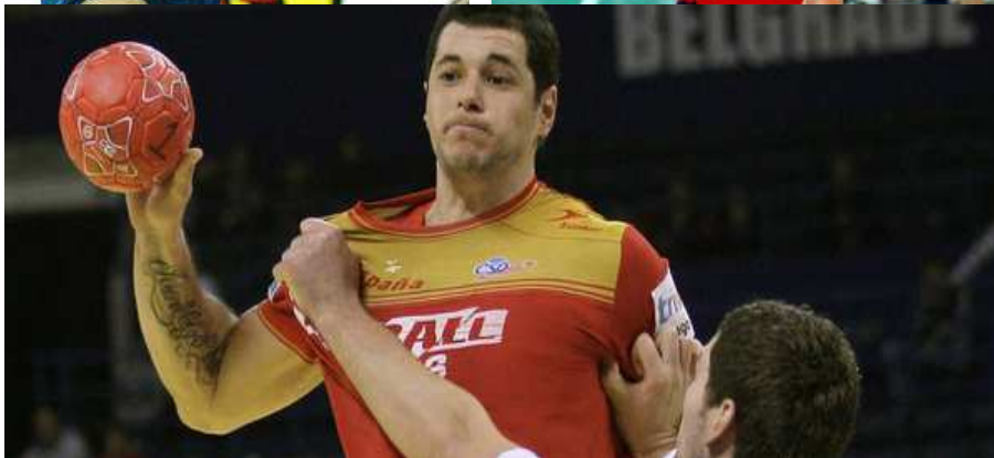
Talant Dujshebaev (izq), Magnus Wislander (derc) y Alberto Entrerrios, bicampeón del mundo (abajo) grandes figuras de este deporte