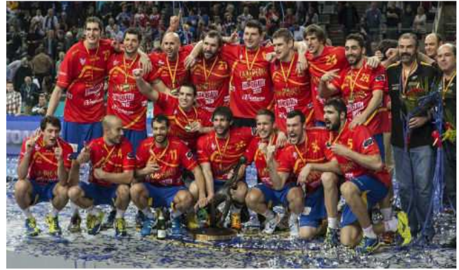
A la izquierda la Selección española ganadora del campeonato del mundo de balonmano 2005 al ganar en la final a Croacia por 40-34 siendo entrenados por Juan Carlos Pastor. A la derecha, la selección ganadora del mundial 2013 al ganar a Dinamarca por 35-19 siendo su entrenador Valero Rivera